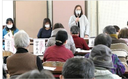
福祉のまちづくり:介護相談