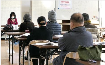
福祉のまちづくり:法律相談