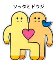
ソッタとドウジ 大津市社協マスコットキャラクター

“ソッタとドウジ”は公募の中から選ばれた愛称で、住民が主人公である地域福祉活動を支援することの大切さを込めて名づけられました。 禅の言葉に「啐啄同時(そったくどうじ)」という表現があり、親鳥が雛(ひな)をかえすときのタイミングの大切さを意味しています。