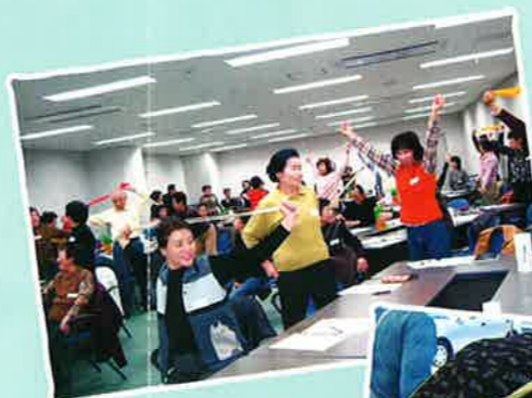
サロン交流会 いきいき体操で笑顔と健康が わいてきます

4 学区社協は、学区全体の地域福祉を高めるために様々な事業を実施しています。研修会や講演会、集いなどの事業に積極的に参加し、学区の地域福祉活動を進めてください。