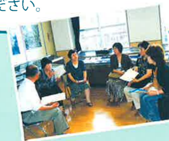
地域ケア会議 ひざを突き合わせて 意見交換をしました