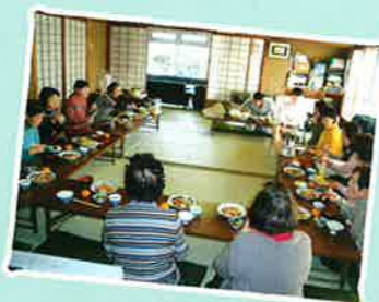
ふれあいサロン 手づくりのお食事で 交流会を行いました