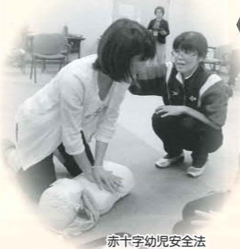
赤十字幼児安全法